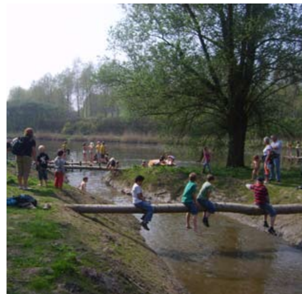
Met z'n allen boven het water

Bewegen is gezond. En buiten bewegen is nog gezonder. In de natuur is van alles te zien en te doen. Hutten bouwen, sporen zoeken en boompje klimmen. Spannende kruip-door-sluip-door paadjes volgen. Kriebelbeestjes bekijken, of dammen maken met zand, water en takken.