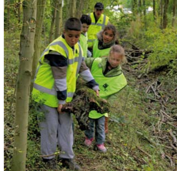
Samen een brug bouwen

Bewegen is gezond. En buiten bewegen is nog gezonder. In de natuur is van alles te zien en te doen. Hutten bouwen, sporen zoeken en boompje klimmen. Spannende kruip-door-sluip-door paadjes volgen. Kriebelbeestjes bekijken, of dammen maken met zand, water en takken.